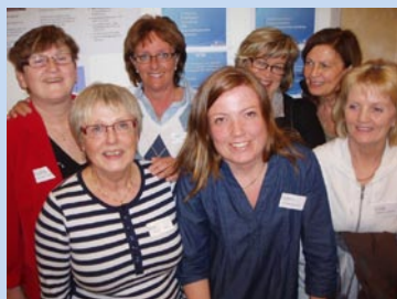
BASp från Örnsköldsvik presenterade sin verksamhet på Möjlighetens torg