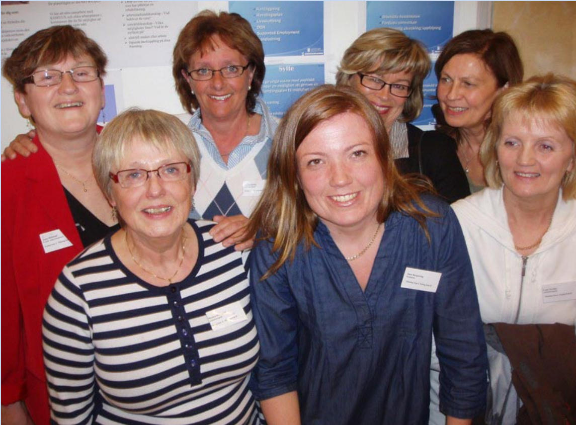
Konferensdeltagare från BASp i Örnsköldsvik.

Konferensen arrangerades av Socialpsykiatriskt forum, i samarbete med Socialstyrelsen, Sveriges kommuner och landsting, ÅSA-nätverket, RSMH, Fontänhusen Sverige, SKOOPi och Ersta Sköndal Högskola.